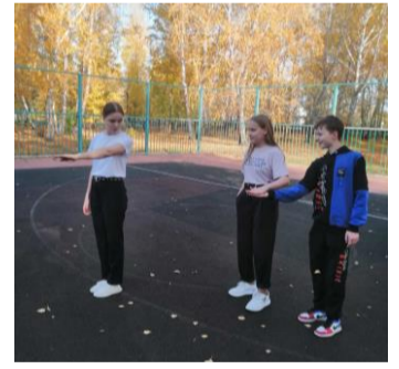
А это День учителя, наверное, самый яркий и торжественный праздник.