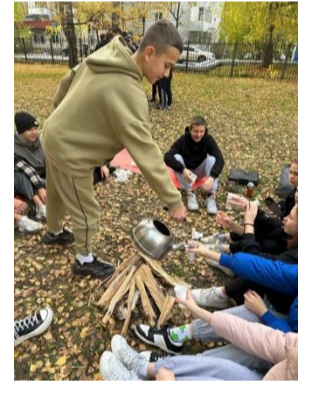
Во всю шла подготовка ко Дню пожилого человека.

Все лицеисты уже начали готовиться к ежегодному лицейскому балу. «Вальс начинается. Дайте ж, сударыня, руку...».