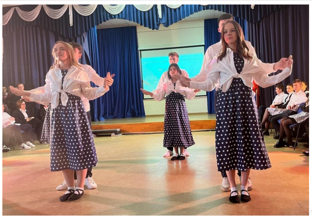
Наш номер был вдохновлён фильмом «Лёд».

1 декабря 110 лет со дня рождения Виктора Юзефовича Драгунского (1913-1972) – русского советского писателя, автора повестей и рассказов. Объявлен конкурс на лучшее письмо другу, в котором спрятались названия произведений В. Ю. Драгунского.