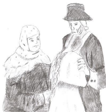
«Капитанская дочка» Рис. Шатовой Екатерины, 8 а

Няня в светлице Глядит в окно на дорогу, Ей одиноко.