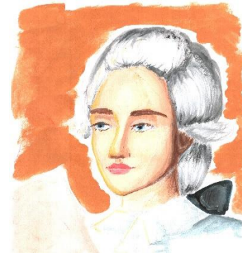
«Капитанская дочка» Рис. Мамедовой Дарьи, 8 и