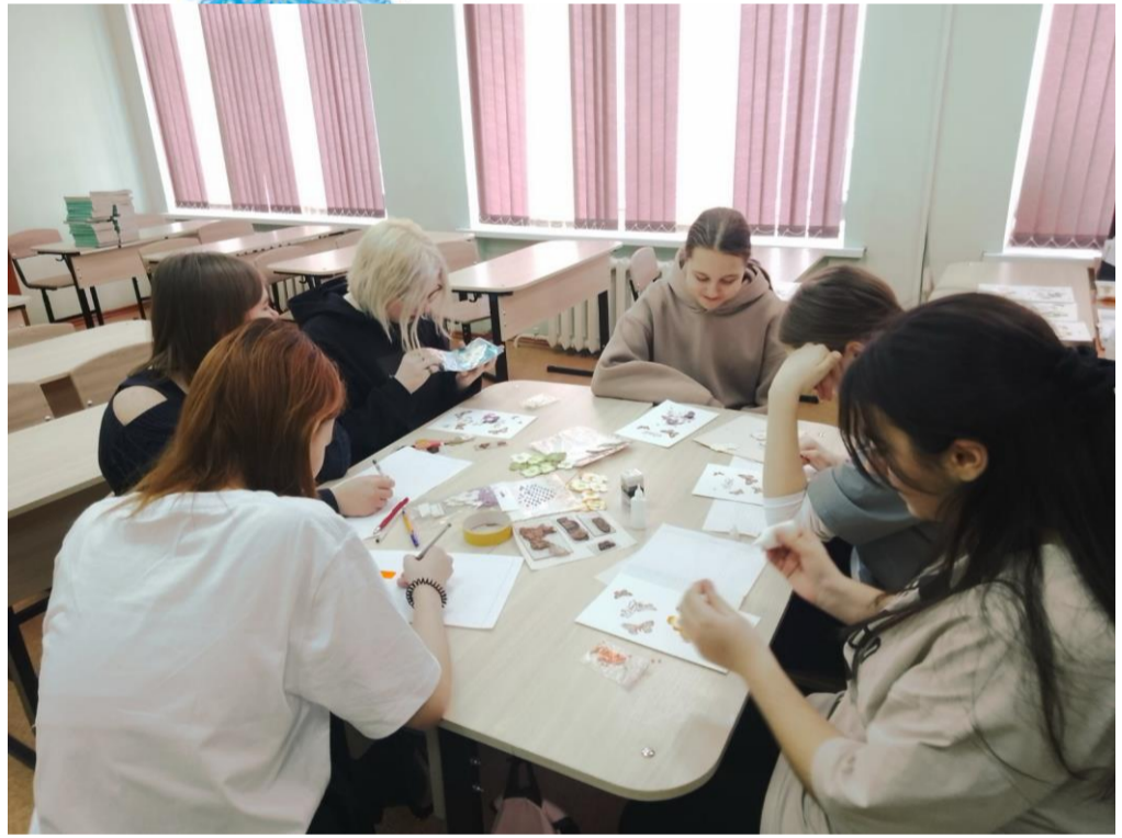
Учащиеся 7-8 классов делают открытки своими руками для медицинских сестер.